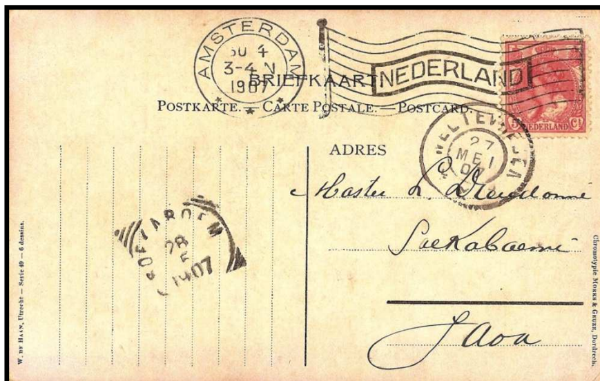
Figure 3 : Oblitération « drapeau » sur lettre d'AMSTERDAM (NL), datée du 30 avril 1907, à destination de SAEKABAEMI (Java).