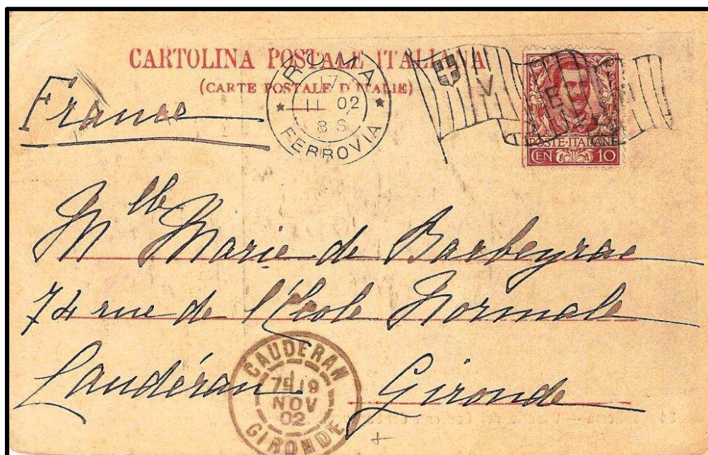
Figure 3 : Oblitération « drapeau » italienne utilisée dans le bureau de poste de la gare centrale de Rome le 11 février 1902, sur carte postale à destination de Landéran (F).