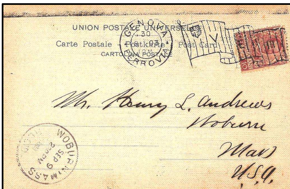
Figure 4 : Oblitération « drapeau » italienne utilisée dans le bureau de poste de la gare centrale de Genes le 30 août 1903, sur carte postale à destination de Woburn (USA).