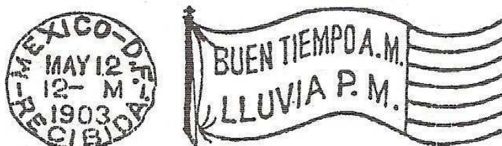
Figure 4 : Reproduction de l'oblitération « drapeau » météorologique mexicaine utilisée par la poste à Mexico. (F. LANGFORD, Flag cancel encyclopedia , Pasadena, 2008).

Le plus fréquent porte la mention « BUEN TIEMPO A.M. / LLUVIA P.M. », soit « bon temps le matin, pluie l'après-midi » (fig. 4).