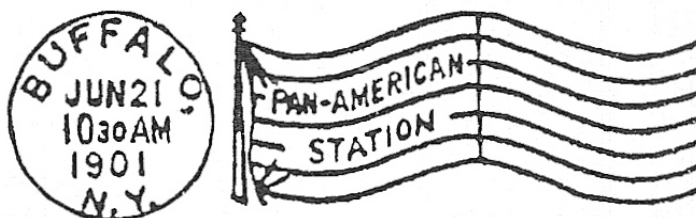
Figure 1 : Oblitération « drapeau » américaine du type Barr-Fycke.

Afin de se distinguer du drapeau produit par la machine American , le drapeau de la machine Barr-Fycke contient sept lignes ondulées coupées en leur milieu par une barre verticale ; le côté gauche du drapeau contenant du texte.