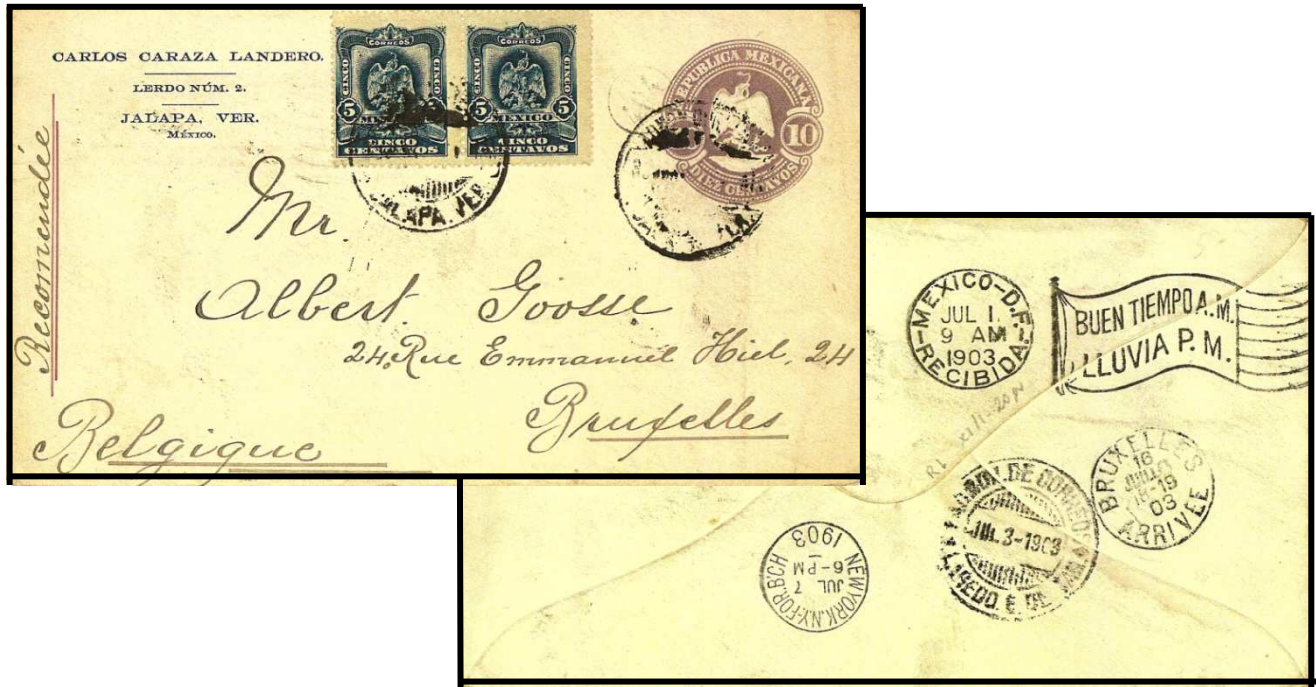
Figure 5 : Recto et verso d'une lettre recommandée de Mexico, datée du 1 er juillet 1903, à destination de Bruxelles, portant au verso l'oblitération drapeau météorologique « BUEN TIEMPO A.M. / LLUVIA P.M. » (collection Roger BOGEART).

En plus des Etats-Unis et du Mexique, des machines Barr-Fyke réalisant des oblitérations « drapeau » ont été également utilisées en Australie et en Nouvelle-Zélande.