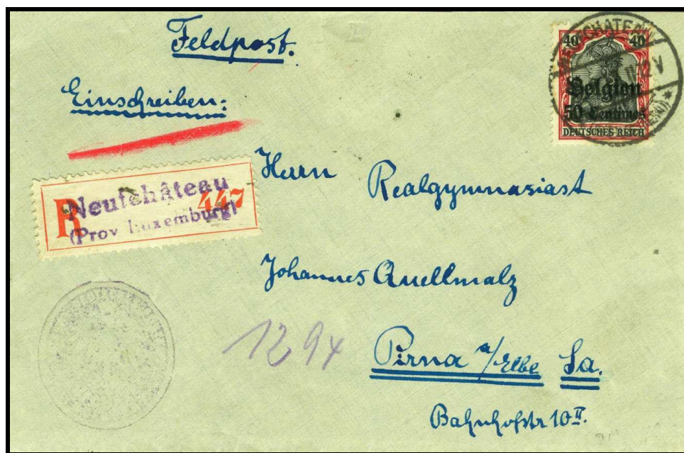
Fig.1 : Devant de l'enveloppe recommandée, envoyée de Neufchâteau, le 22 août 1917, à destination d'un étudiant de Pirna a/Elbe en Allemagne.

En bas, au milieu, des chiffres écrits au crayon violet se lisent : 1294.