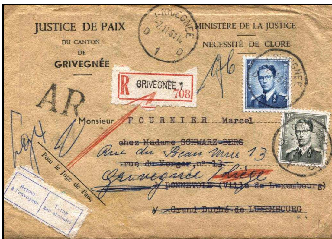
Figure 1 : Recto de la lettre recommandée envoyée de Grivegnée le 7 novembre 1961 à destination de Luxembourg (G-D Luxembourg).

Comme elle est affranchie à 13,0 FB, le port est exact, car il n'y a pas de franchise pour l'étranger.