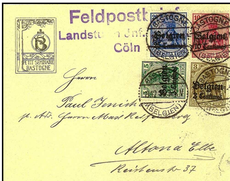
Figure 1 : Enveloppe envoyée de BASTOGNE (B) vers ALTONA (D), le 19 décembre 1914. DIEST (B.).