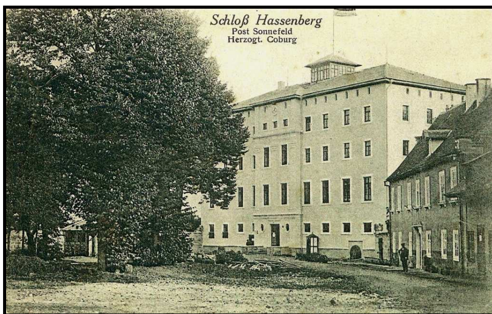
Figure 2 : Recto de la carte-vue envoyée le 7 décembre 1914 d'HASSENBERG à destination de MUSSON.

Au recto, nous découvrons une photo du château d'Hassenberg, leur lieu d'internement, accompagnée du texte suivant : « Schloss Hassenberg / Post Sonnefeld / Herzogt [um] Coburg » (château d'Hassenberg / Post Sonnefeld / Duché de Cobourg).