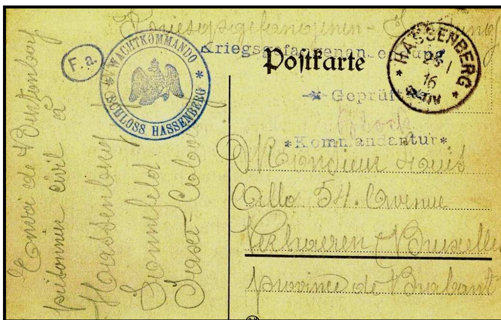
Figure 3 : Verso de la carte postale envoyée le 16 janvier 1916 d'HASSENBERG à Destination de BRUXELLES.

Après avoir décrit notre document exceptionnel : la carte-vue signée le 7 décembre 1914 par trois otages, nous reproduisons une carte postale « ordinaire » d'HASSENBERG, écrite le 16 janvier 1916 par un certain BURTONBOY, prisonnier civil, à destination de BRUXELLES. Ce château-prison abritait en 1916 quelques dizaines de civils belges prisonniers et des officiers français.