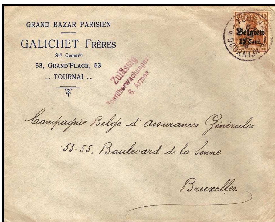
Fig. 1 : Cachet original en violet sur lettre de TOURNAI, datée du 7 octobre 1916, vers BRUXELLES.

Cette estampille est relativement facile à trouver et est sans doute représentée en plusieurs exemplaires dans des collections spécialisées.