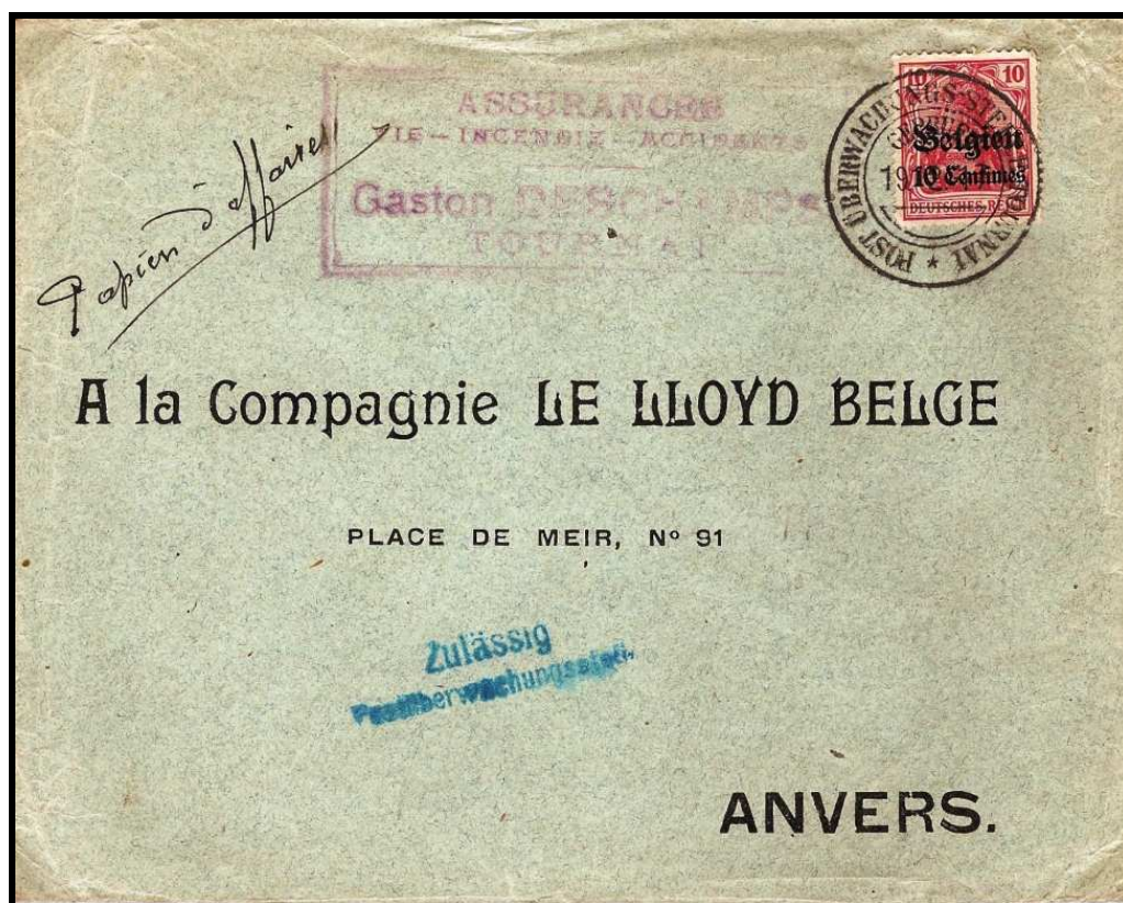
Fig. 3 : Cachet amputé en bleu sur lettre de TOURNAI, datée du 19 février 1917, vers ANVERS.