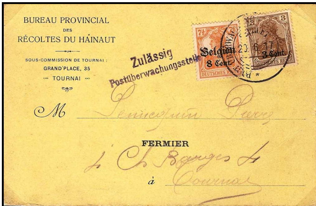
Fig. 4 : Cachet amputé en violet-noir sur carte postale de TOURNAI, datée du 20 juin 1917, en service local. Affranchissement mixte de timbres-poste du Gouvernement Général et des Etapes.