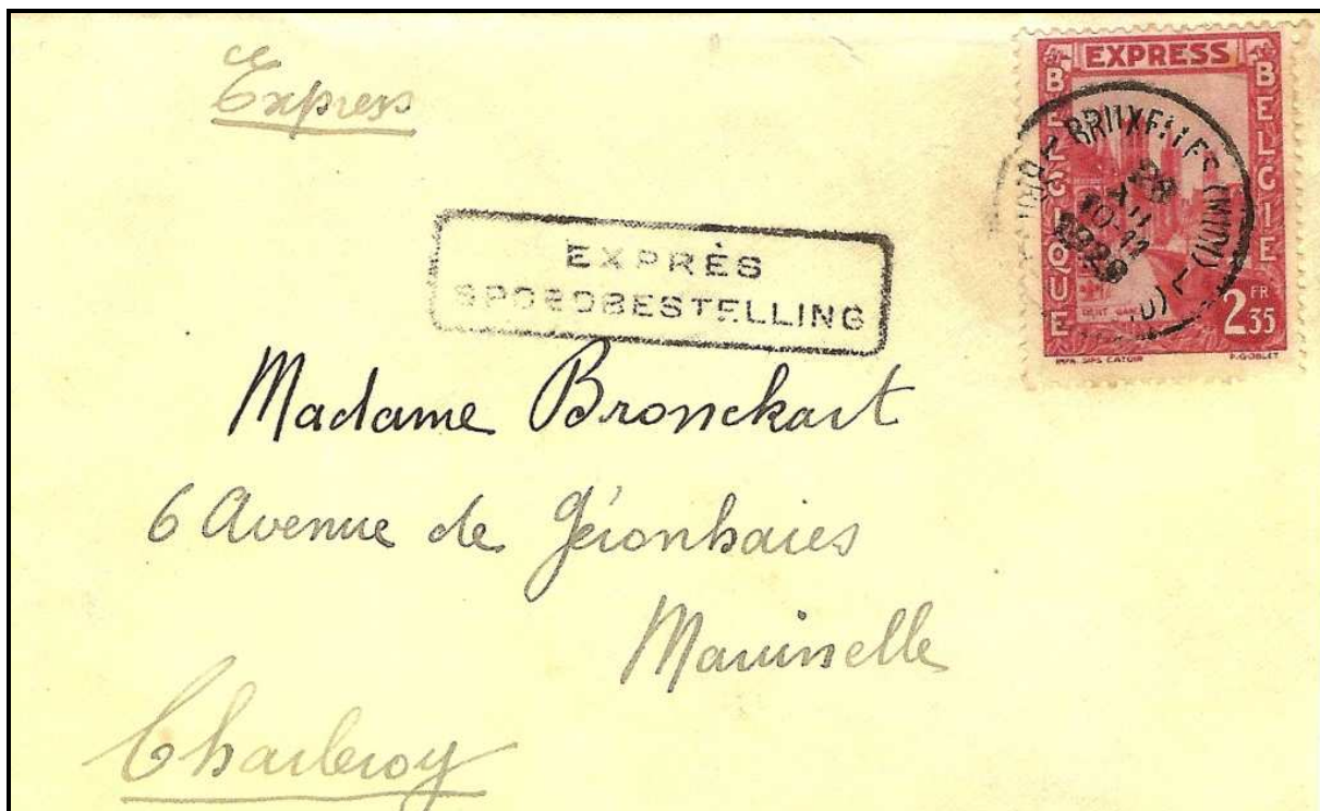
Fig. 2: Lettre expédiée de Bruxelles le 28 décembre 1929, affranchie par le timbre « exprès » à 2,35 FB.