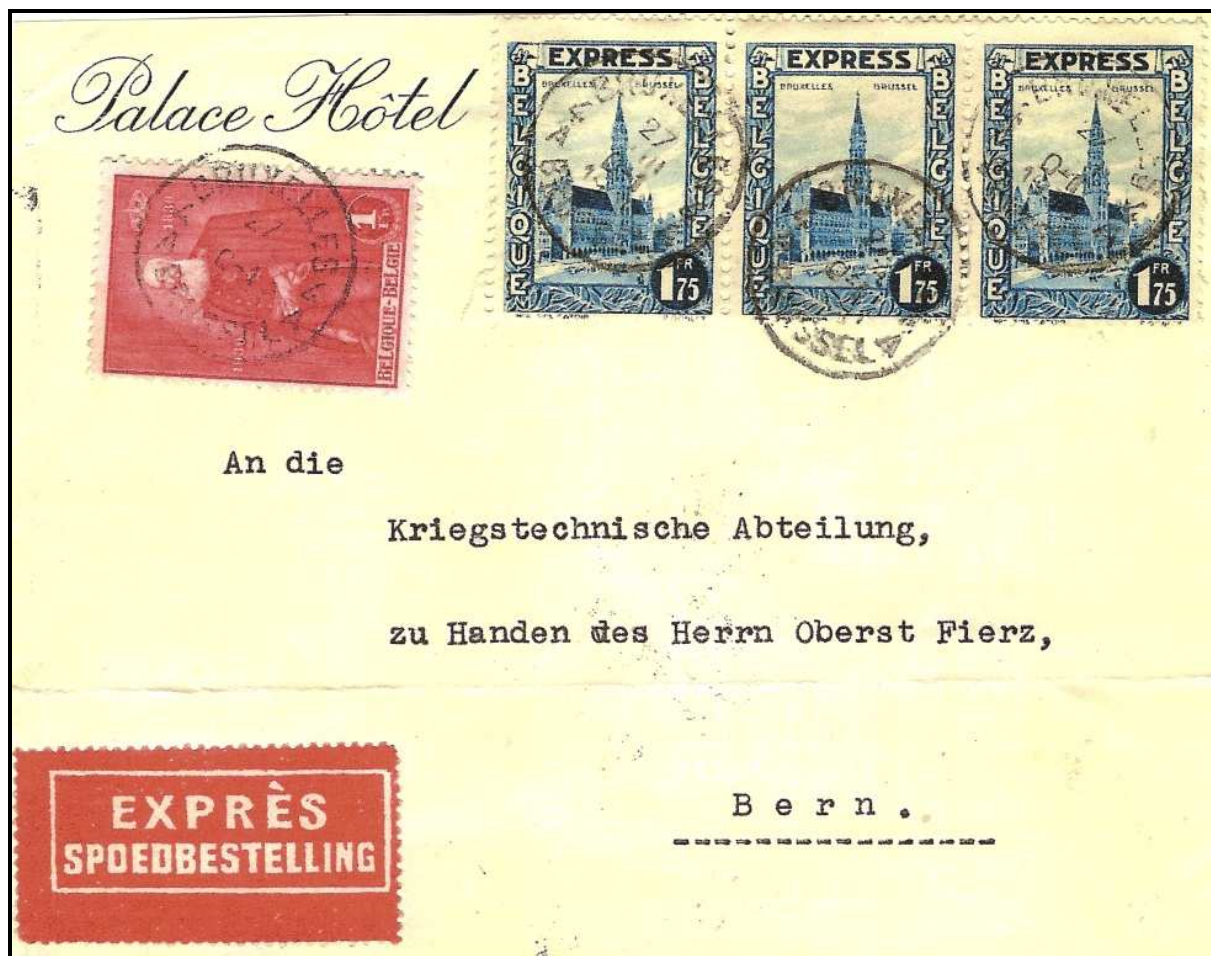
Fig. 3 Lettre expédiée de BRUXELLES vers la SUISSE. Le port de 6,25FB se décompose comme suit : double port, soit 1,75 FB pour les premiers 20 gr. et 1,0 FB pour les 20 gr. supplémentaires + 3,50 FB de taxe d'express.