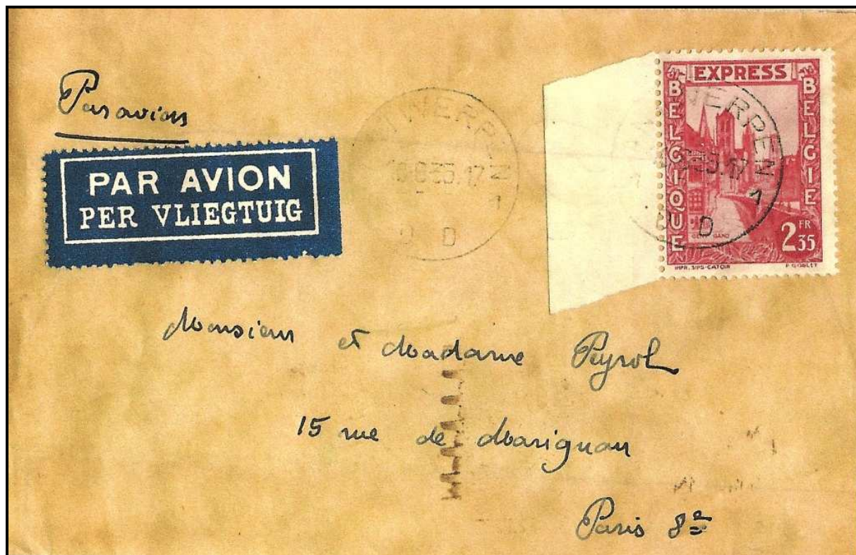
Fig. 4 : Lettre qui normalement n'aurait pas dû être acceptée puisque n'affranchissant pas un envoi par « exprès », mais qui a néanmoins été envoyée d'ANTWERPEN vers la FRANCE. Port normal de 1,75 FB + 50 cts. de surtaxe aérienne, soit 2,25 FB. Il y a donc 10 cts. de trop. L'expéditeur avait probablement ce timbre chez lui et a déposé la lettre à la boîte. Un cachet de passage à BRUXELLES et celui de PARIS AVIATION se trouvent au dos de cette lettre.