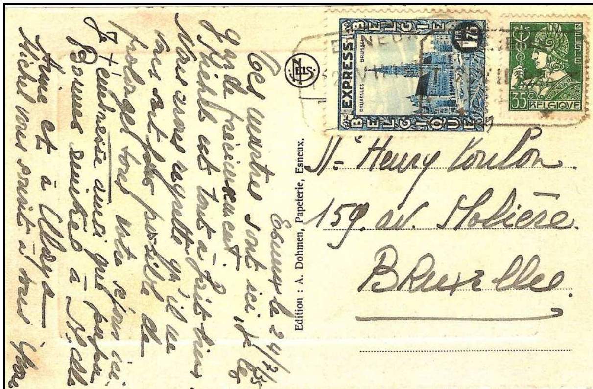
Fig. 1 Carte postale illustrée affranchie à 35 cts. plus le timbre « exprès » de 1,75 FB, oblitérée par le cachet télégraphique d'ESNEUX.