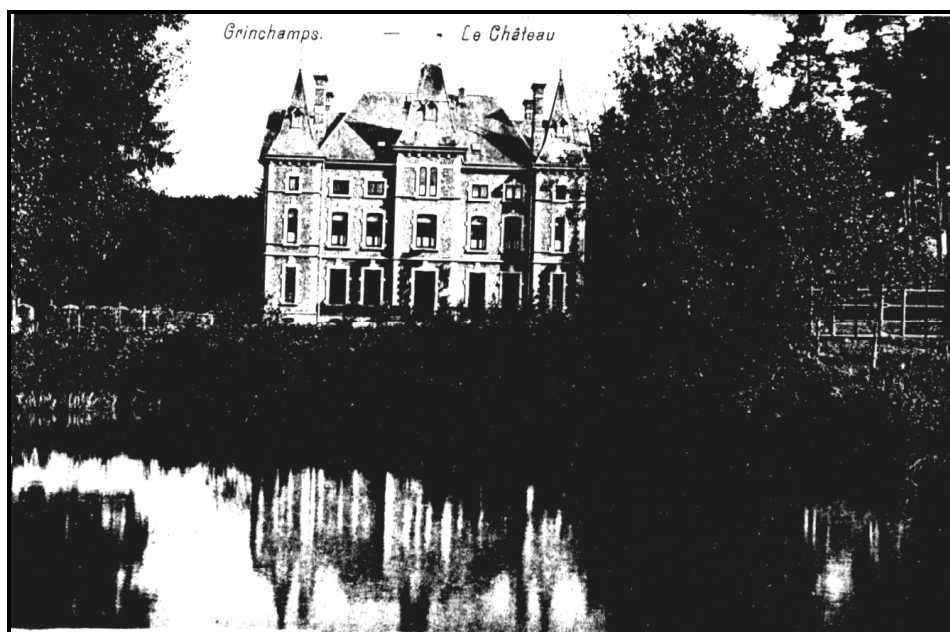
Figure 2. : Carte Postale illustrant le château de GRAINCHAMPS vers 1948.

Le modeste hameau de GRAINCHAMPS, relais de poste comparable à celui de FLAMISOULLE, redonnait pour le temps d'une guerre son nom à une marque postale.