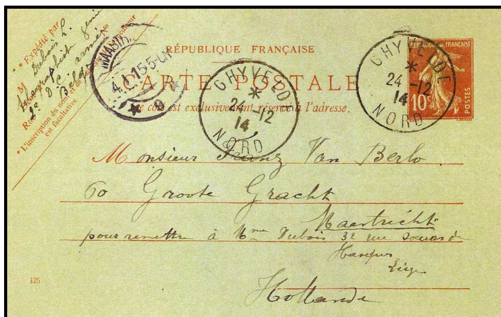
Figure 1 : Carte postale expédiée le 24 décembre 1914 de GHYVELDE à destination de MAASTRICHT, arrivée clandestinement à LIEGE.